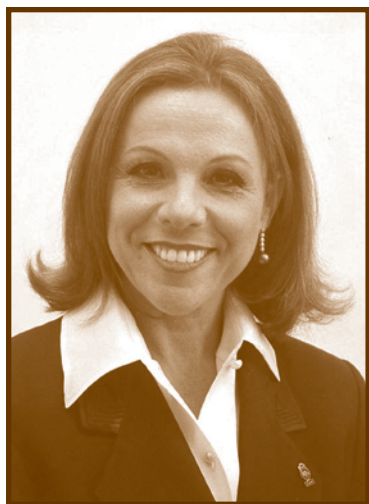
Faingezicht Waisleder Aida