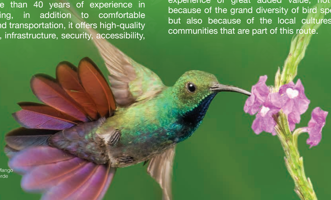
Green-breasted Mango Manguito Pechiverde

The National Bird Route of Costa Rica was developed for bird watchers as a circuit that integrates virtually all of the key birdwatching locations in the country. This provides an experience of great added value, not only because of the grand diversity of bird species, but also because of the local cultures and communities that are part of this route.