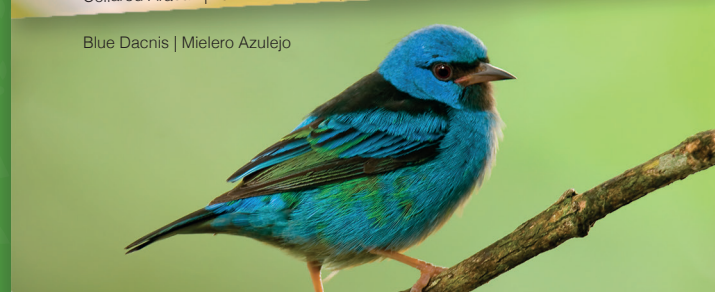
Blue Dacnis | Mielero Azulejo