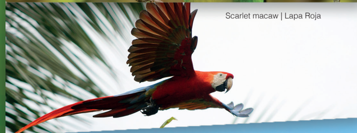
Scarlet macaw | Lapa Roja