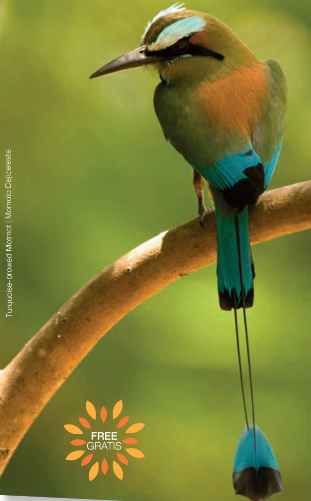
Turquoise-browed Motmot | Momoto Cejileste