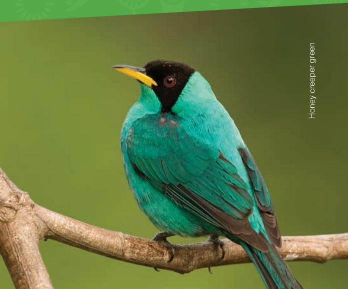
Honey creeper Green