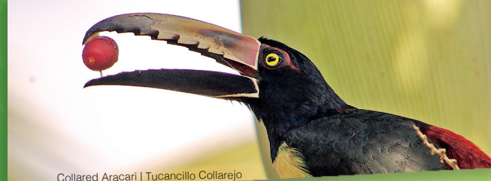
Collared Aracari | Tucancillo Collarejo