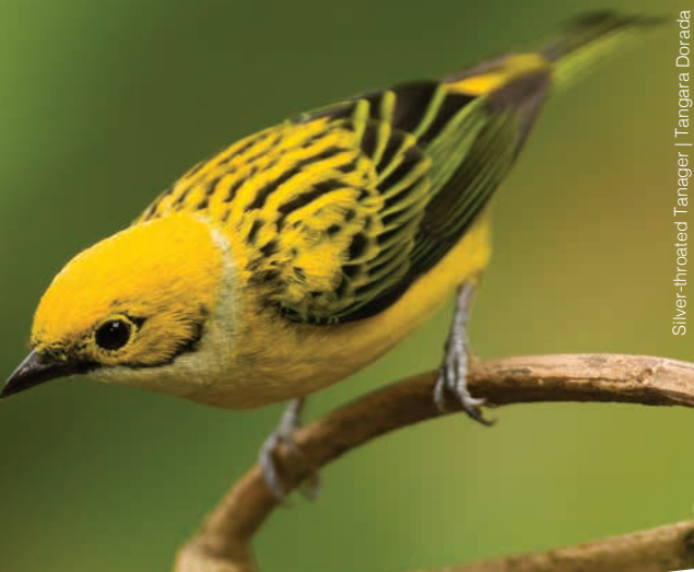
Silver-throated Tanager | Tangara Dorada