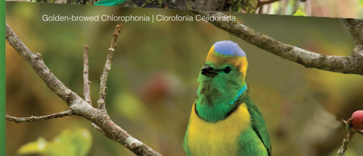
Golden-browed Chlorophonia | Clorofonia Cejidorada