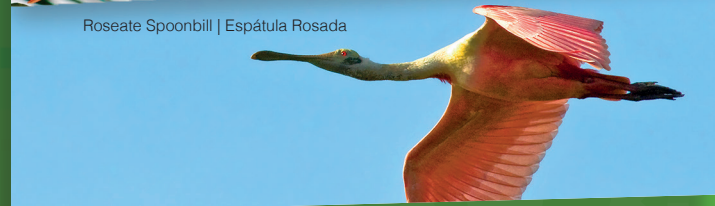
Roseate Spoonbill | Espátula Rosada