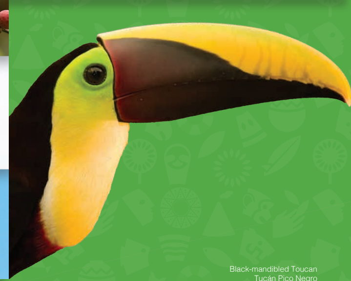
Black-mandibled Toucan Tucán Pico Negro

En costa Rica tenemos aproximadamente 51 especies de aves marinas, así como unas 167 especies de aves acuáticas.