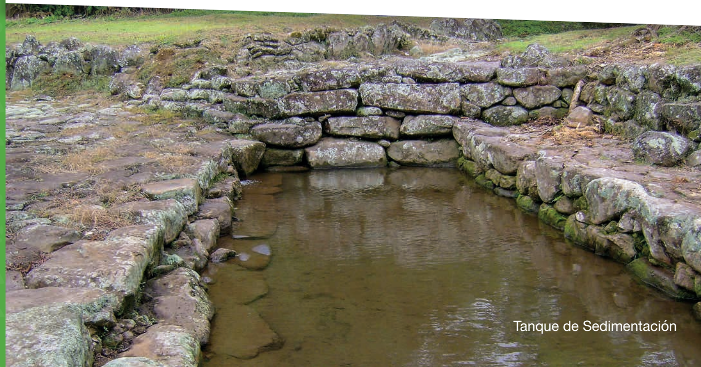
Tanque de Sedimentación

Un sendero completamente natural donde es posible escuchar el susurro del agua proveniente del río Lajitas y de un pequeño afluente llamado quebrada La Chanchera, que lo acompañará por casi la totalidad del sendero.