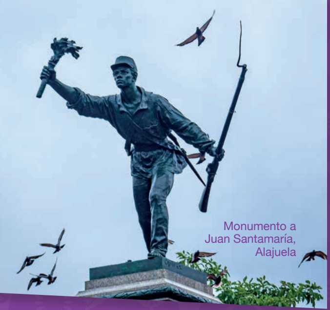
Monumento a Juan Santamaría, Alajuela