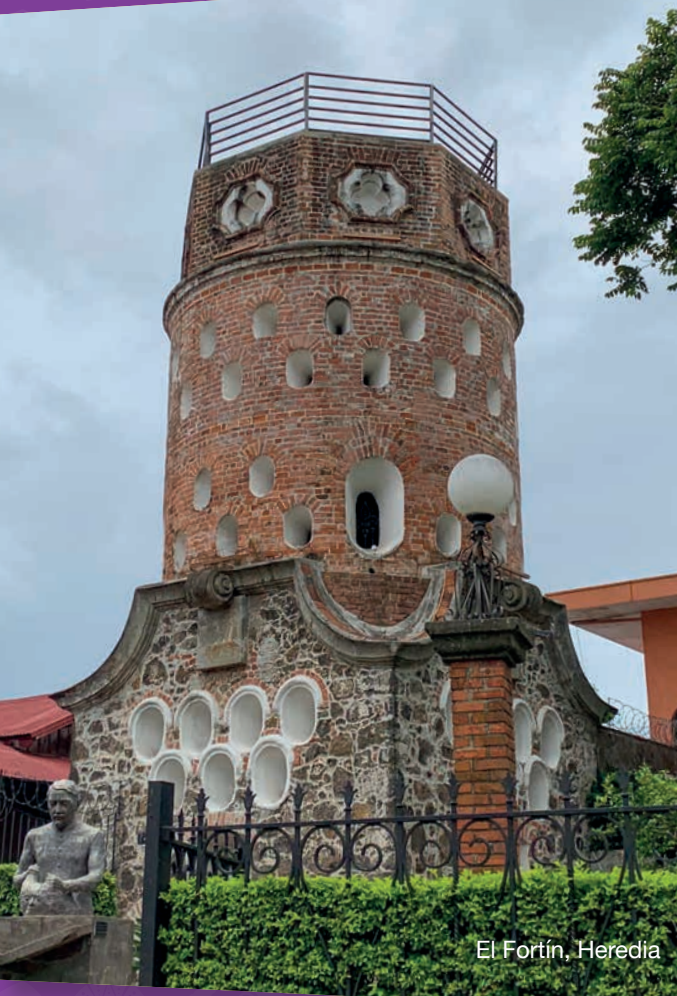
El Fortín, Heredia

Las principales ciudades del Valle Central ofrecen una variedad de servicios comerciales y turísticos de gran calidad. Los pueblos rurales, por su parte, son pintorescos y ofrecen un vistazo de la Costa Rica de antaño, con sus casitas de bahareque (un material de construcción similar al adobe), grandes plantaciones y beneficios de café, trapiches y lecherías.