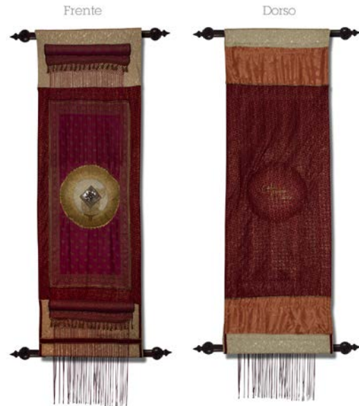
Técnica: Mixta sobre tela, ensamble de textiles intervenidos con pinturas y objetos Dimensiones: 202 cm x 66 cm Serie: Plegarias por los pueblos, 2015